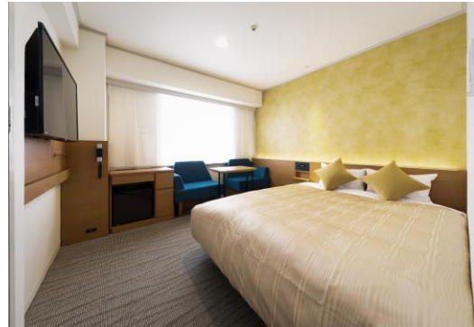
プレミアムダブル