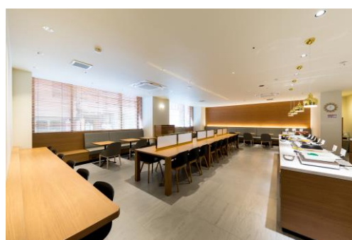
ラウンジ(朝食会場)