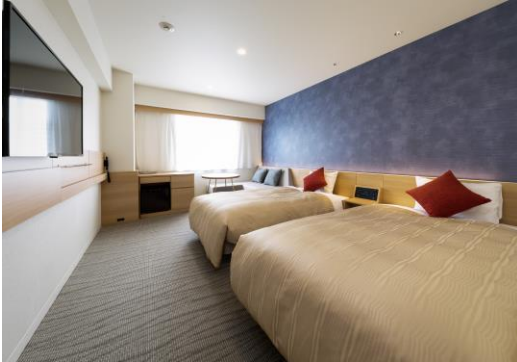
プレミアムツイン