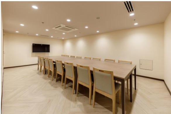
< ห้องประชุม >

เหมาะสำหรับการจัดกิจกรรมหลากหลายรูปแบบ พร้อมทั้งมีโทรทัศน์ขนาด 55 นิ้วให้บริการอีกด้วย