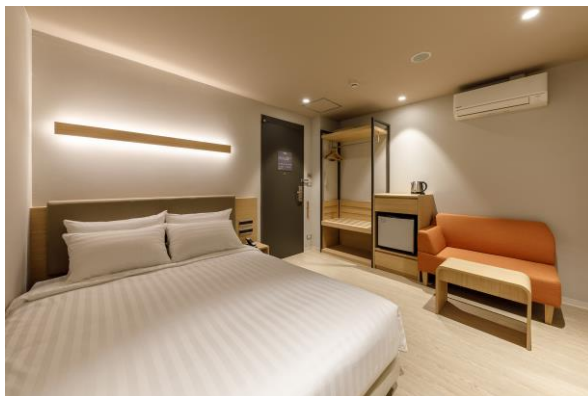
< ห้องแสดนดาร์ตเตียงเดี่ยว >