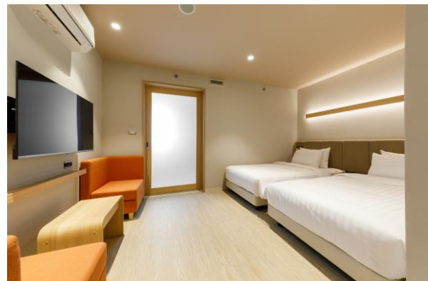
< ห้องแสดนดาร์ตเตียงคู่ >