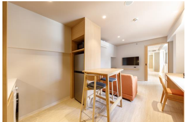
< ห้องคูร์มสเตย์สวีท >