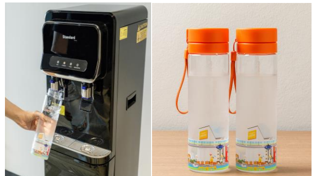
< Water Tumbler >

ชุดนอนสไตล์ไทยมอบความสบายและความผ่อนคลายให้กับผู้สวมใส่