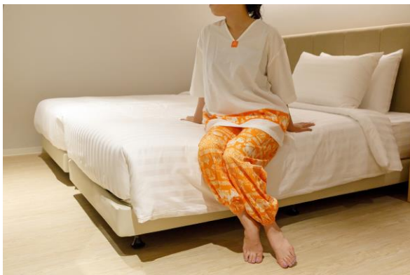
< Nightwear >

ชุดนอนสไตล์ไทยมอบความสบายและความผ่อนคลายให้กับผู้สวมใส่