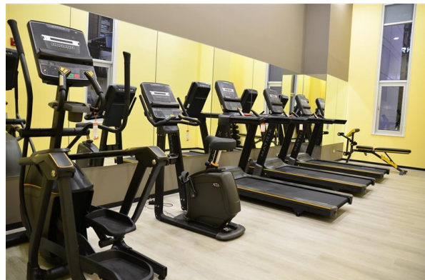
< ห้องออกกำลังกาย >

เหมาะสำหรับการจัดกิจกรรมหลากหลายรูปแบบ พร้อมทั้งมีโทรทัศน์ขนาด 55 นิ้วให้บริการอีกด้วย