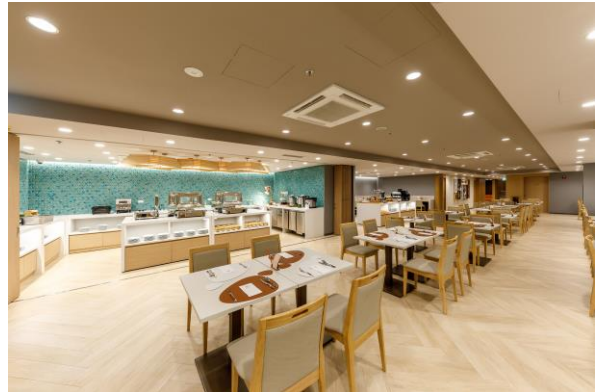
< ห้องอาหาร >

พื้นที่ร้านอาหารสามารถใช้เป็น Co-working space ได้ ในช่วงนอกเวลาบริการอาหารเช้า