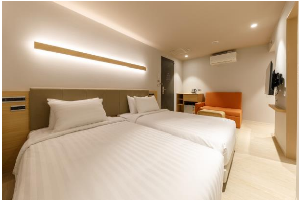
< ห้องดีลักซ์เตียงคู่ >