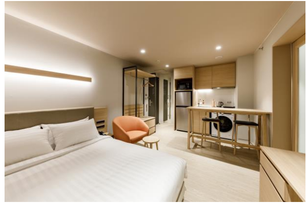
< ห้องดีลักซ์สเตย์ >