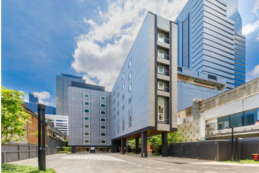
บริเวณภายนอกของโรงแรม